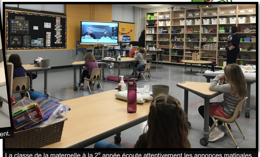
La classe de la maternelle à la 2 e année écoute attentivement les annonces matinales.